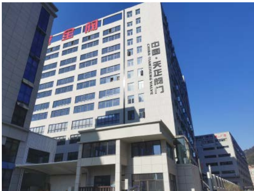
图 1-1 公司产业园