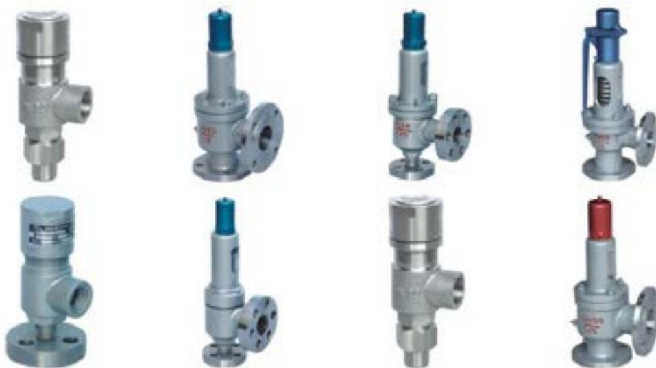
图 1-2 公司主要产品